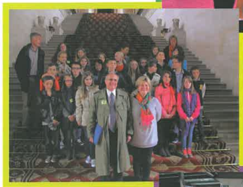
Photo de famille en bas de l'escalier monumental.

Croisière sur la Seine. On écoute la guide nous parler des monuments.