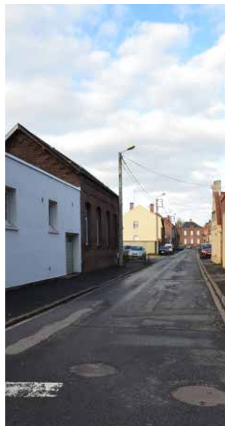
Rue Jean Lebas