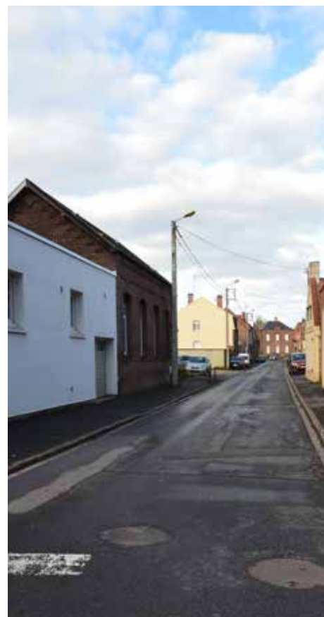
Rue Jean Lebas