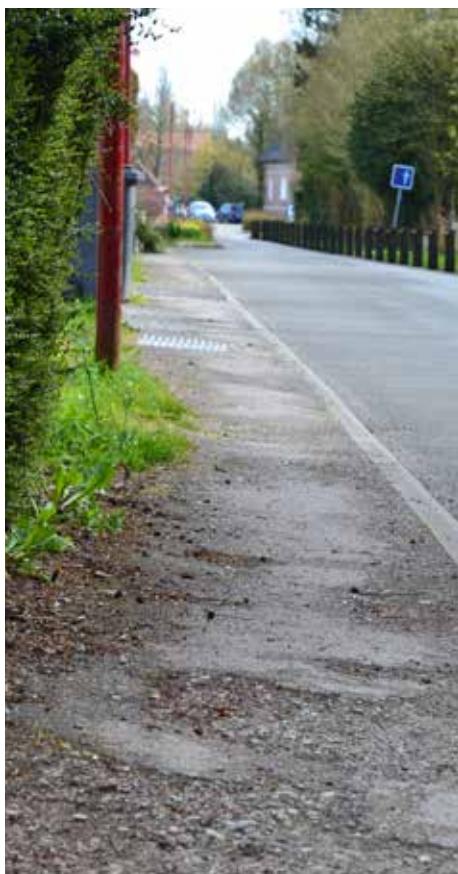
Rue Lucien Sampaix