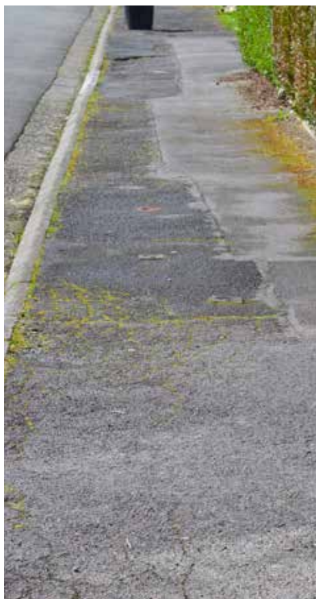
Rue des Genêts

Les travaux à charge de la commune seront, eux, réalisés postérieurement (au mieux lors du dernier trimestre de cette année). Une information complète sera donnée en son temps.