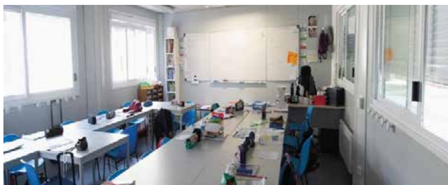
Exemple de l'intérieur d'un «bâtiment modulaire» qui permettra d'assurer, durant l'année des travaux, les conditions optimales pour les enfants et les enseignants. Dans une recherche d'économie, l'école maternelle sera également ré-aménagée pour accueillir 4 classes dans de bonnes conditions.