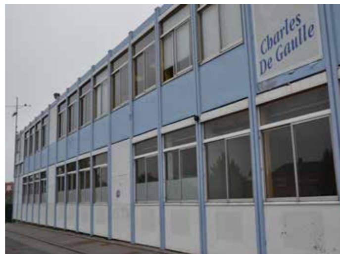
Le Groupe Scolaire Charles de Gaulle. Un bâtiment du début des années 1970, de type «Pailleron» : ce qu'il est convenu d'appeler «une passoire thermique».