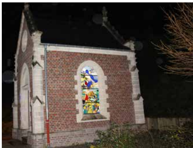
Création - Réalisation : Judith Debruyne