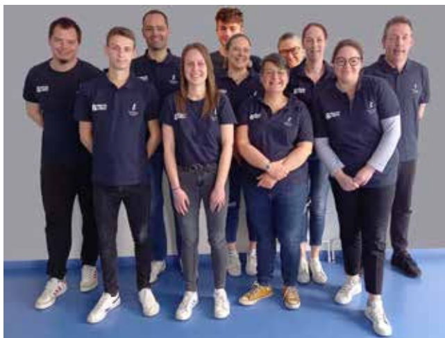
Photo de gauche à droite :

Ce sont des animateurs et animatrices diplômé(e)s. Ils accompagnent, divertissent et surveillent nos enfants scolarisés à l'école Charles de Gaulle pendant les temps de garderie, de restaurant scolaire, de pause méridienne mais aussi lors des activités périscolaires. Des nouveautés ont d'ailleurs été proposées cette année (comme l'aide aux devoirs, le multisport, le micro-atelier et la découverte de la nature) qui ont repris en octobre.