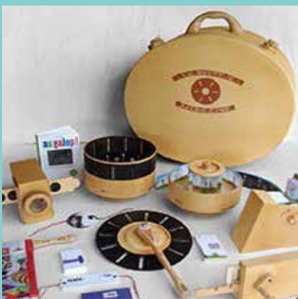
Exposition peinture MicroAtelier