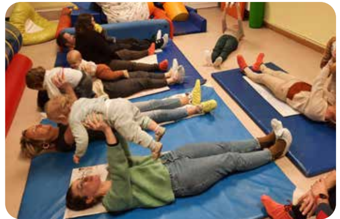
Atelier relaxation, détente avec les parents