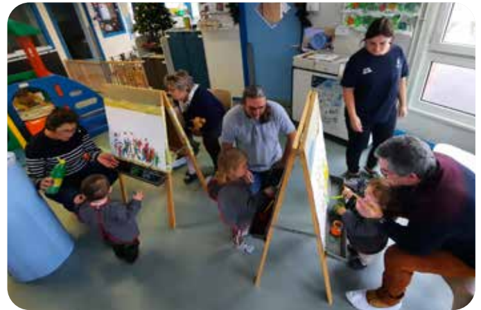
Atelier peinture avec les grands-parents