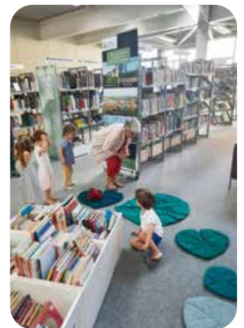
Sortir pour découvrir le monde de l'Art et de la Culture à la médiathèque.